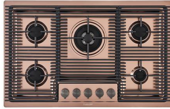
Placa de cocción Milanello Copper 5F 7682 008