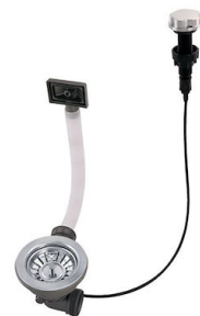
Desagüe automático 8407 000