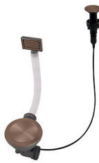
Desagüe automático Space Push Copper 8407 122