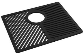
Griglia Black 8100 652