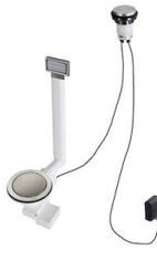
Desagüe automático Space Light - PL 8407 117