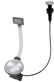
Desagüe automático Space Push - PP 8407 116